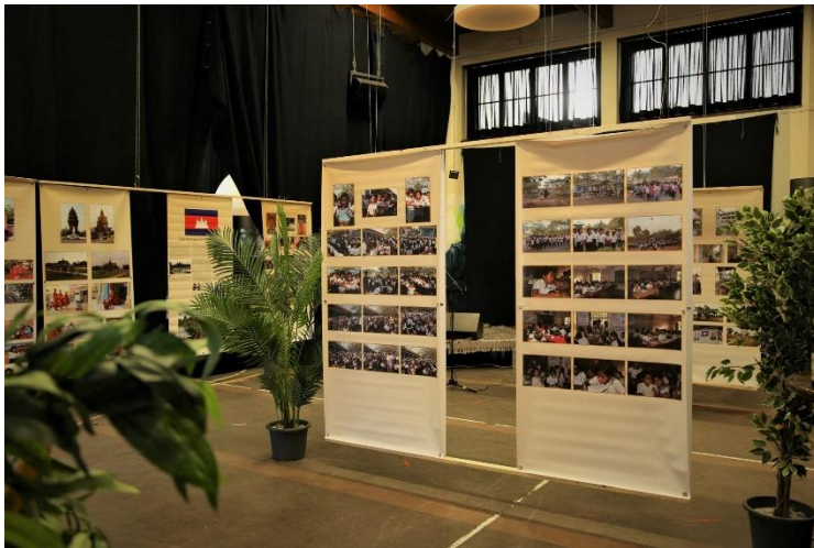
Fotoausstellung des Kambodschaners Ponsomach Pok

Zu Beginn des Abends konnten die Besucher bei einer Fotoausstellung des Fotografen Ponsomach Pok in die Kultur Kambodschas eintauchen. Die Fotos zeigten die Region Kompong Speu, Poks Heimat. Gleichzeitig wurden die Gäste mit kambodschanischen Köstlichkeiten und einer musikalischen Einlage von Najman verwöhnt.